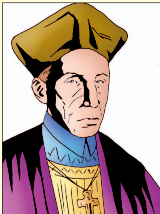
PEDRO DE LA GASCA

Encomendado por Pedro de La Gasca, Alonso de Mendoza llevó adelante la fundación de Nuestra Señora de La Paz en 1548, La Paz alberga hoy en día a habitantes de todo el país y el resto del mundo, siendo además sede de gobierno y uno de los departamentos más importantes de Bolivia e incluso de Latinoamérica